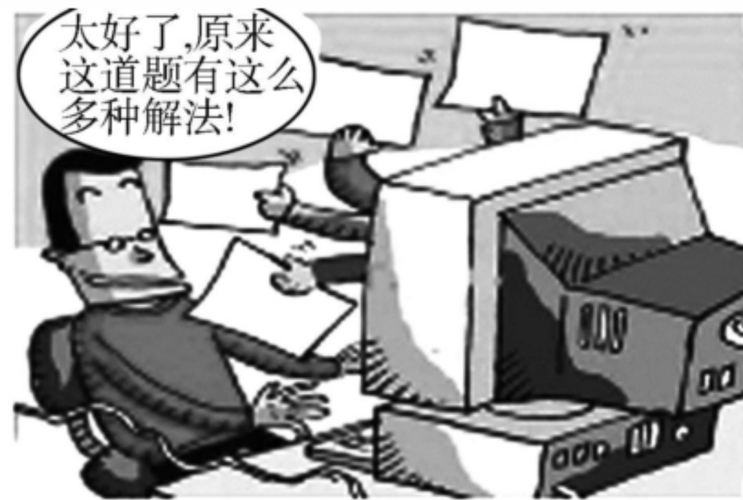
漫画二:网上互助学习