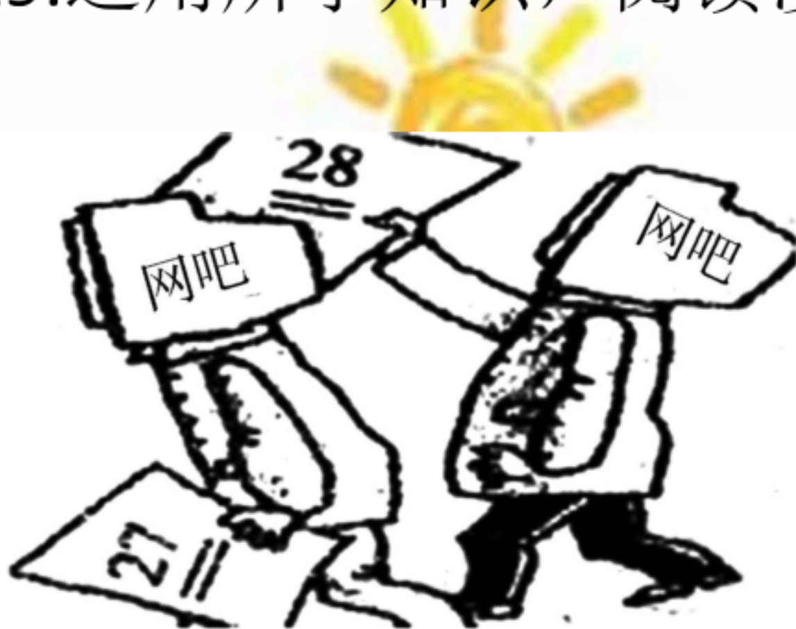
漫画一:可怜的成绩