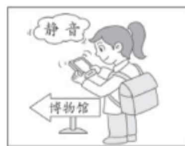
参观时手机调静音