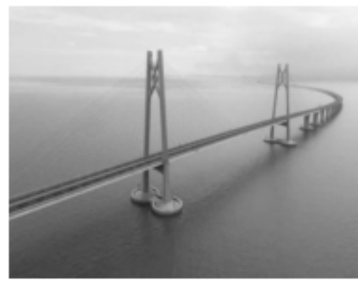
2018 年港澳珠大桥正式开通