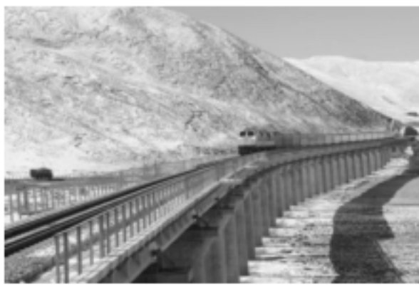
2006 年青藏铁路全线通车