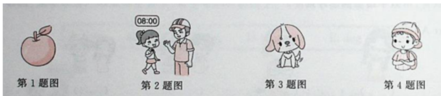
第 1 题图