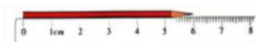
铅笔长 6 厘米

(2)方法一：用物体的一端对准尺子的 0 刻度 ，另一端对着 刻度几 ，物体的长度就是 几厘米 。